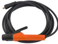
Welding cable 5 m 16 mm 2