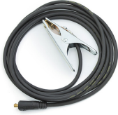
Earth return cable 5 m, 16 mm 2